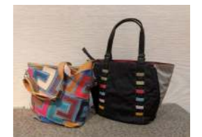
軽くてカラフルなバッグたち

これから、もっと皆さま方に悦んでいただけるアイテムを増やしていきますので、どうぞご期待ください。