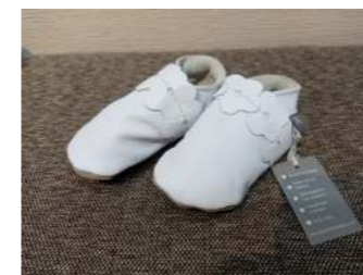
イギリス製のベビーシューズ

新しいお取引先さまとのご縁で、ライフスタイル上の様々な商品を少しずつ、気に入ったものだけを チョイスしてお届けできるようになってきました。