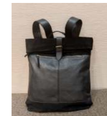
イタリア製のメンズリュック